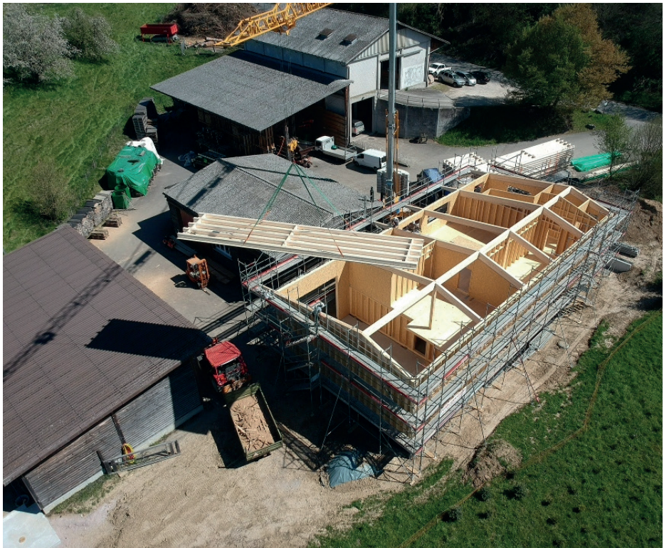
Neubau Forstwerkhof, April 2026

Die Einweihung des neuen Forstwerkhofes ist auf den 16. August 2026 festgesetzt. Zum jetzigen Zeitpunkt sind wir bestens aufgestellt, um dieses Ziel zu erreichen. Wir freuen uns jetzt schon, zusammen mit dem Forstbetrieb Region Möhlin und der Bevölkerung der Umgebung dieses Projekt würdig einzuweihen.