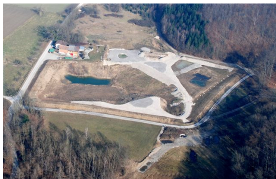
Naturschutzgebiet «Burstel» aus der Vogelperspektive