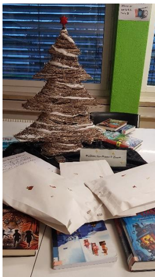
Über hundert Basteltüten wurden in der Weihnachtszeit zusammengestellt.

Vor Ostern und für die Weihnachtszeit haben wir für alle Kinder Basteltüten zusammengestellt. Darin befanden sich jeweils ein Basteltipp und eine passende Geschichte. Die Basteltipps und die Geschichten konnten auch auf der Homepage heruntergeladen werden. Ein kleiner Trost für alle, die die Bibliothek nicht besuchen konnten. Dieses Angebot fand bei Klein und Gross grossen Anklang.