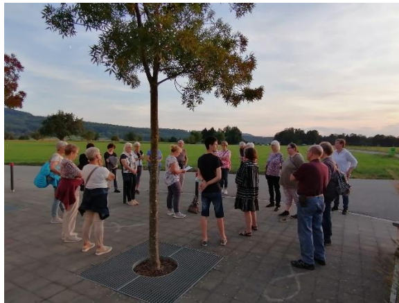
Krimi-Wanderung dieses Jahr mal im September