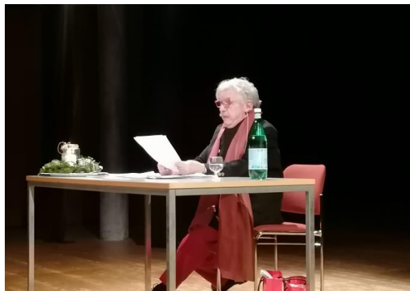
Ausverkaufte Lesung mit -minu im Steinli-Chäller