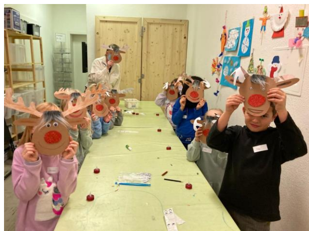
Märlistund und Basteln - seit Jahren beliebt und immer ausgebucht.

Alle unsere 6 angebotenen Märlistunden mit Basteln waren ausgebucht und an jedem letzten Mittwoch im Monat wurde unserer Mario Kart Gaming rege genutzt. Es ist grossartig, den Kindern dabei zuzusehen, wie sie so nebenbei soziale Werte wie Gewinnen, Verlieren und Rücksicht nehmen lernen. Es können jeweils nur 4 Kinder gleichzeitig spielen und der Gewinner der Runde muss seinen Controller ans nächste wartende Kind abgeben.