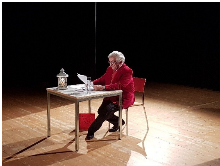
Adventslesung mit -minu

Neben bewährten wie die Vollmondkrimiwanderung im Mai mit fast 100 Teilnehmern, oder der Adventslesung mit -minu mit über 90 begeisterten Zuhörern versuchen wir immer wieder neue, informative und interessante Veranstaltungen anzubieten.